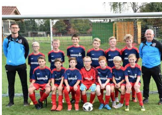
Mannschaftsfoto der D1, Saison 2019/2020