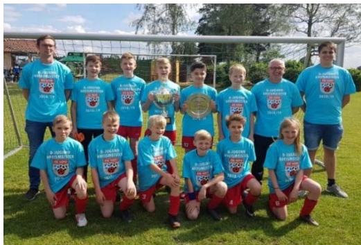
Meisterfoto der D1, Saison 2019/2020